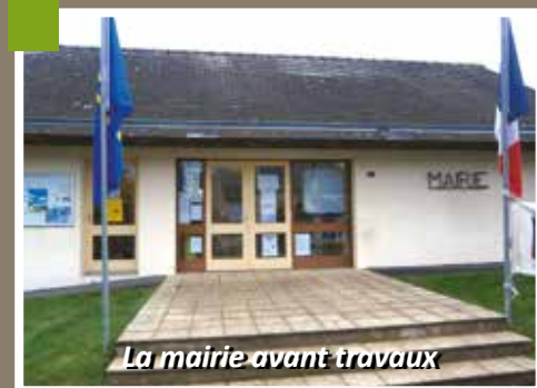
La mairie avant travaux