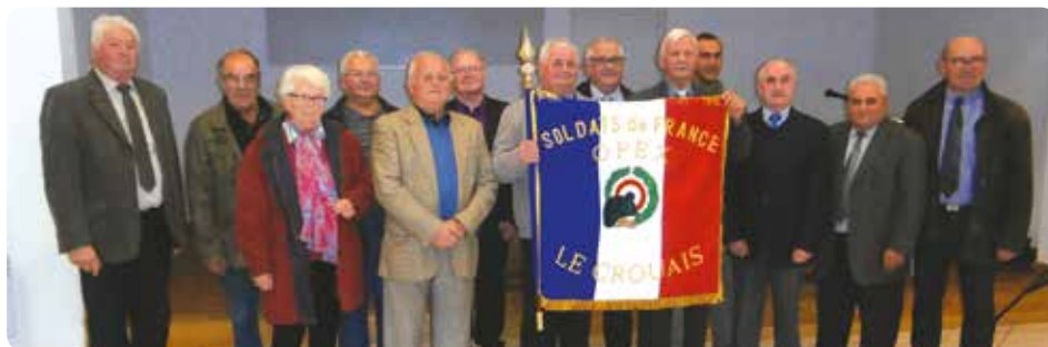
Le 16 octobre 2015 a eu lieu une cérémonie pour la remise du Drapeau des Soldats de France et Opex.

Décoré de la médaille de la valeur militaire aux Invalides, et récemment le 2 avril dernier de la médaille militaire qui est la plus haute distinc-